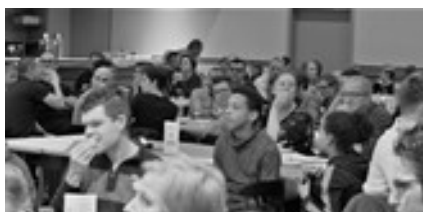
Gezellige drukte op het jaarlijkse clubfeest

Ze waren met meer dan ooit: een kleine 50 jeugdathleten namen deel, onder begeleiding van meerdere jeugdtrainers.